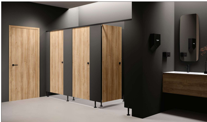
La empresa tiene la marca, Movifen, dedicada a la fabricación equipamientos hechos con tablero compacto fenólico.

Maderas Gran Vía de Galicia mantiene su sede y almacén central en el polígono industrial de Mos, donde también se ubica su área de fabricación. El contacto con la empresa puede realizarse por teléfono o correo electrónico, canalizando las consultas hacia el departamento comercial correspondiente.