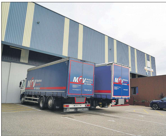
Maderas Gran Vía de Galicia cuenta con flota propia de transporte.